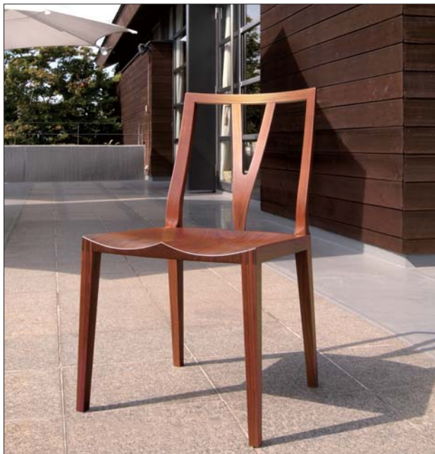
写真はウォールナット材

無垢材の持つ魅力と家具職人の叡智を集約し、可能な限りのシンプルさと快適な座り心地を追求した「GLARE」。 このチェアの最大の特徴である個性的なデザインの背板は、腰から背中にかけての当たりを緩やかなS字で、肩甲骨までの当たりを二股のY字でホールドする、ウィッシュボーン型を採用しています。また、臀部から太ももにかけての体圧が分散されるように削り込まれた座面は、板座とは思えないほどの優しい座り心地と彫刻のように研ぎ澄まされたアートの美しさを併せ持っています。 モダンで洗練されたデザインの中に、椅子としてのあるべき姿を追求した「GLARE」には、職人の鋭い感性と熟練の技が息づいています。