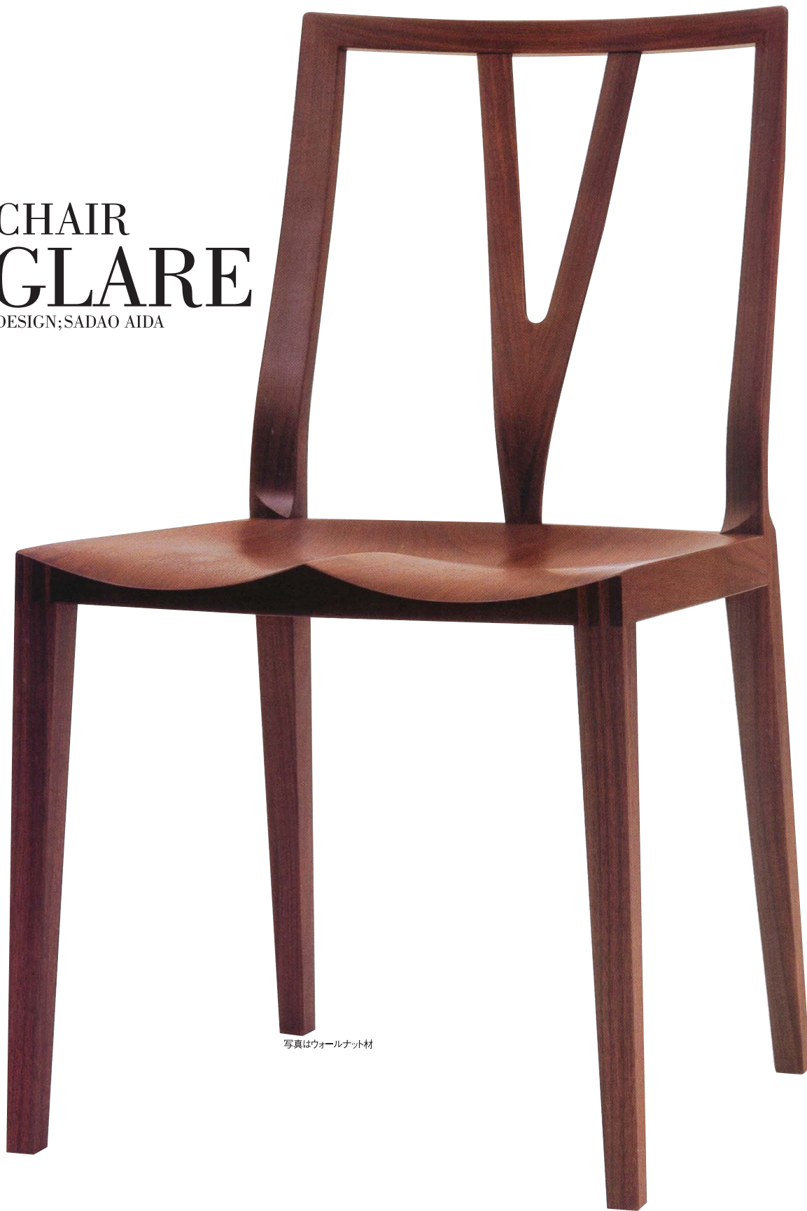
写真はウォールナット材