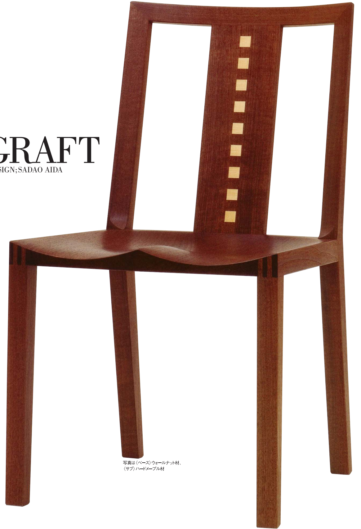
写真は(ベース)ウォールナット材、(サブ)ハードメープル材