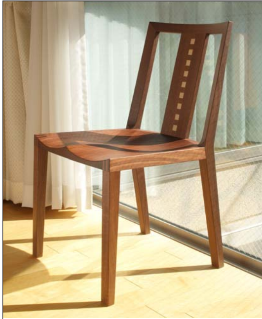
写真は(ベース)ウォールナット材、(サブ)ハードメープル材