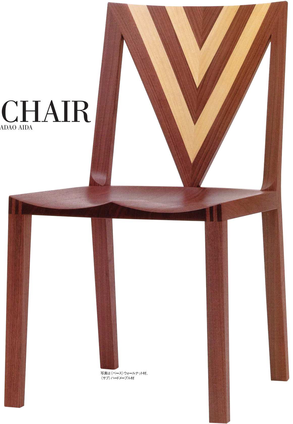
写真は(ベース)ウォールナット材、(サブ)ハードメープル材