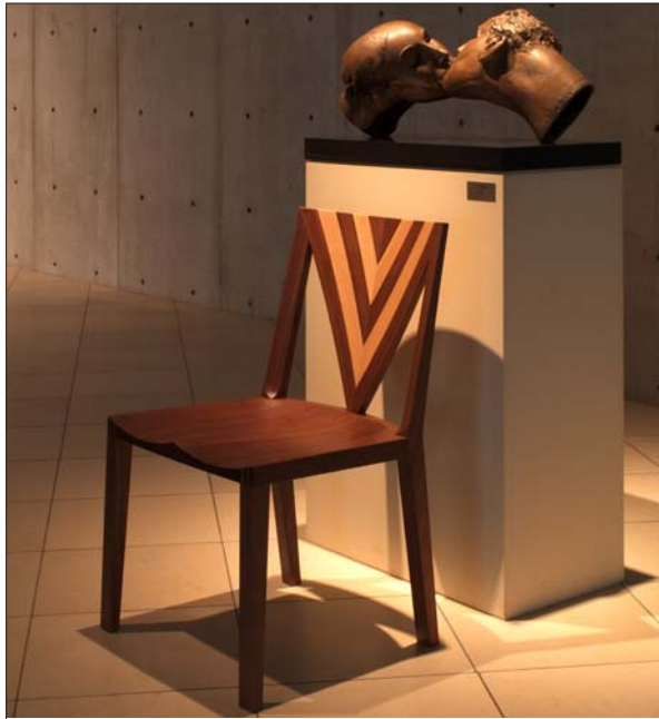
写真は(ベース)ウォールナット材、(サブ)ハードメープル材