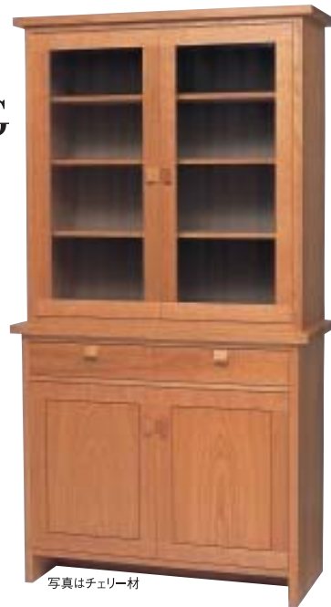
写真はチェリー材

ダイニングボード モデルノ1010 W1010・D450・H1900 ●レギュラータイプ ●棚板(大)4枚 ●別サイズ・別仕様有り