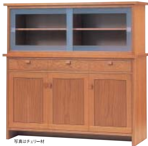
写真はチェリー材

ミドルボード モデルノ1450 W1450・D450・H1400 ●レギュラータイプ ●棚板(大)3枚(小)1枚 ●別サイズ・別仕様有り