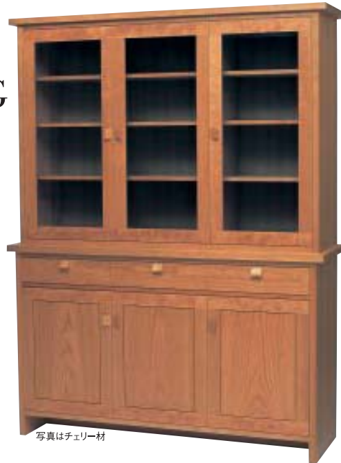
写真はチェリー材

ダイニングボード モデルノ1450 W1450・D450・H1900 ●レギュラータイプ ●棚板(大)4枚(小)4枚 ●別サイズ・別仕様有り