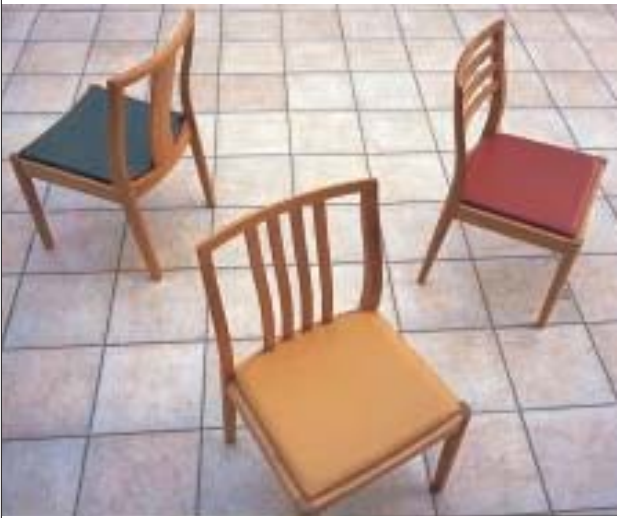
写真はチェリー材

デザイン3種類、銘木6種類、張り地50種類からの自由な組み合わせで、自分だけのスタイルが作れる、ベイスックでスタンダードなチェアです。 笠木と後ろ脚は、斜め45度で接合する「留め」仕事により強度を高め、さらに、「さすり仕上げ」で表面の段差を無くし滑らかに仕上げています。また、後ろ脚、笠木、背板の後ろ面を滑らかな曲面に削り出すことで、正面から見た時とは異なる柔らかな印象を与えています。座面を台輪の内側にすぎ間なくピッタリとおさめる「落とし込み」は、座面まわりをすっきりと見せ、デザイン性を高めることにも、張り地のエッジをすり切れから保護します。 合計900スタイルにも及ぶ豊富なバリエーションは、オリジナルテイあふれるインテリア空間作りに役立ちます。