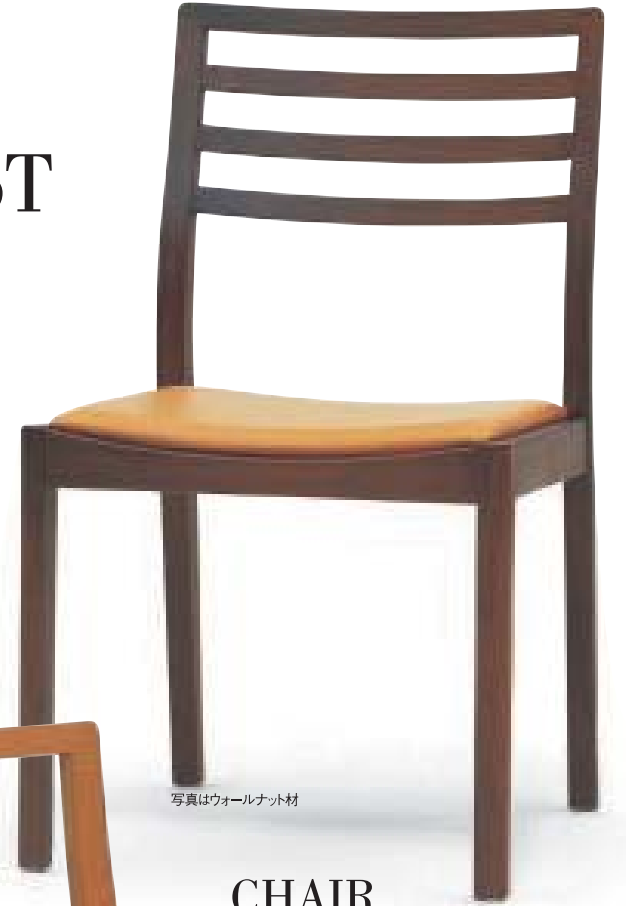
写真はウォールナット材