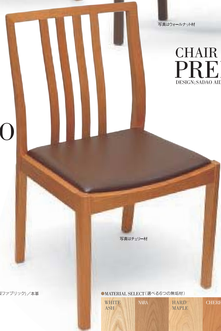
写真はチェリー材