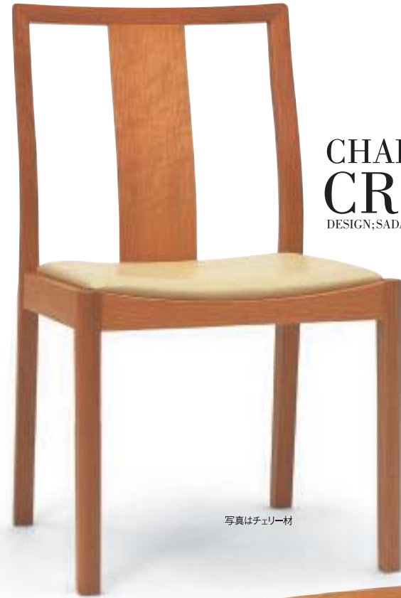
写真はチェリー材