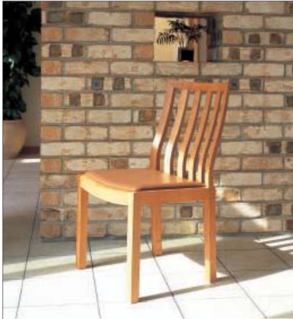
写真はチェリー材

縦の力強いラインが印象的な「STRIPPE」。その名が示すとおり、縞模様をモチーフにしたシャープなデザインでありながらも、有機的で滑らかな曲面を随所に取り入れることで、和とモダンの融合の新鮮さを表現しています。 4本のスポークが美しく連動していくデザインは、それぞれのパーツの幅、パーツ同士の間隔を均等に配置。縦長の直線で構成された完成度の高いシルエットにより、見た目にも安定感を与え、快適な座り心地も実現しています。 「STRIPPE」のデザインは、さまざまなインテリア様式が入り混じる現代の日本の住空間を考慮したもの。もちろん、近年の主流となっているシンプル&モダンな住空間にも、このチェアは美しく調和します。