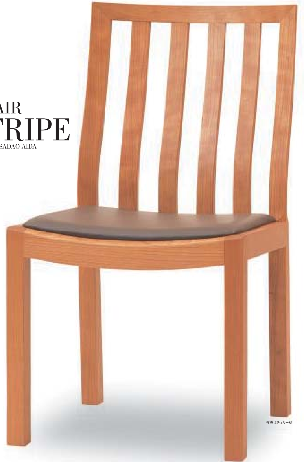
写真はチェリー材