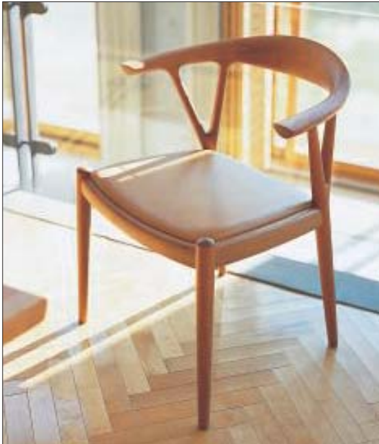
写真はチェリー材

「座る」ためのさまざまな機能を考慮し、優しく包み込むようなフォルムと、シンプルで飽きのこないデザインを追求した「V CHAIR」。2004〜2005年度のグッドデザイン賞に選ばれたこのチェアの最大の特徴は、枝の形状をモチーフとした後ろ脚のV字フォルムです。 大きな弧を描く笠木・アームと一体化した後ろ脚は、幅広で分厚い一枚の板から削り出されています。座面は、臀部の曲線に合わせて中央に向かいゆるやかにカーブさせることで、臀部から太ももにかけての体圧が無理なく分散されるように設計されています。 緻密な設計と高度な削り出しの技術により、快適な座り心地と木目の美しさが際立つフォルムを実現した「V CHAIR」。その有機的なデザインは、どんな住空間にも自然に調和します。