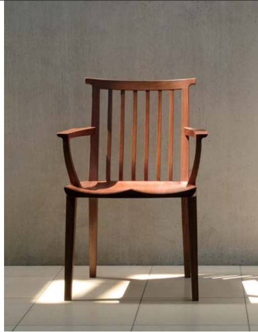
写真はウォールナット材

直線的なイメージを感じさせつつ、有機的で滑らかな曲面を随所に取り入れた「ZEN」。和とモダンが美しく融合した、新しいスタイルのアームチェア&チェアです。